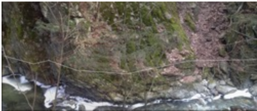
Escarpement en aval de la photo ci-dessus