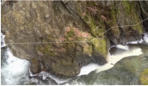
Escarpement rocheux le plus en amont; la ligne indique où se situerait la plateforme de visite