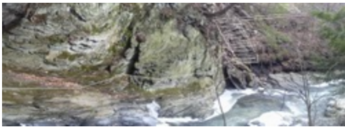
Escarpement le plus en aval; la partie hachurée indique où pourrait se situer l'escalier d'accès depuis la rue Maple